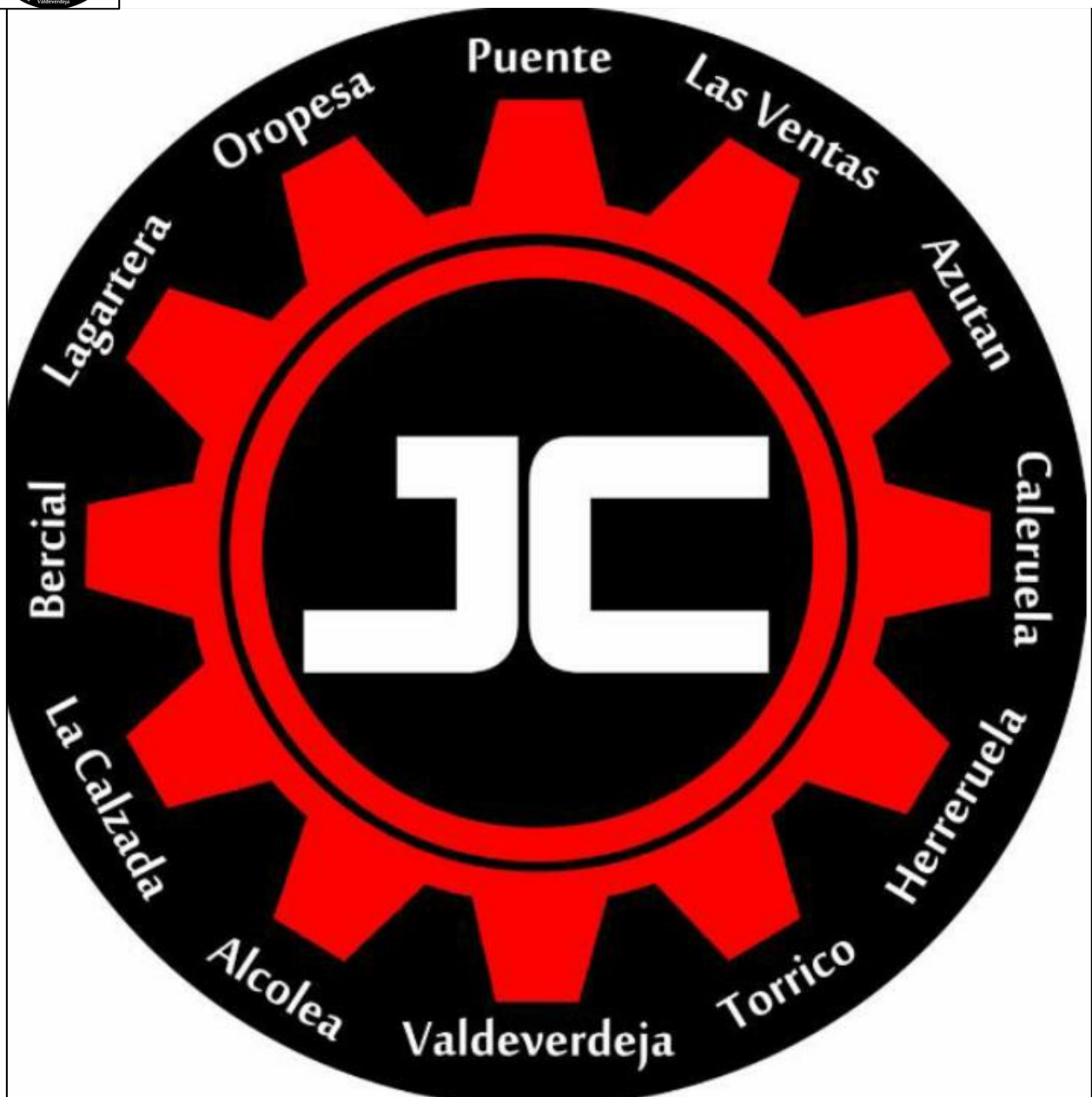
Juegos de la Comarca