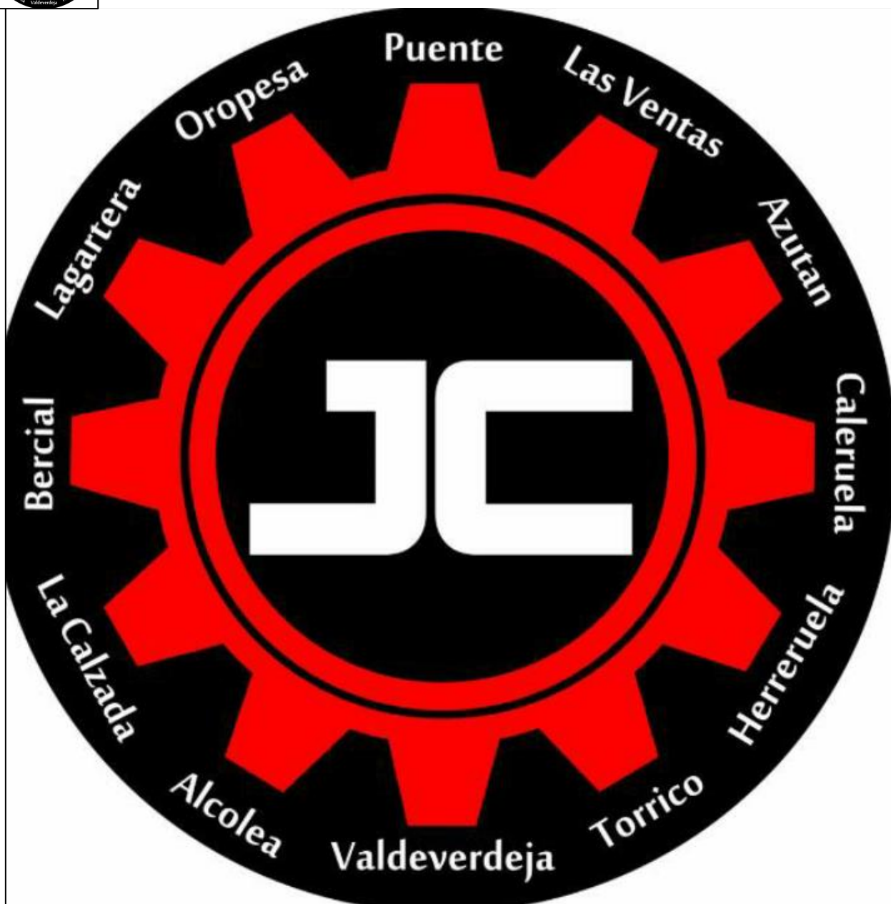
Juegos de la Comarca